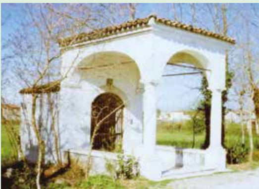
La cappella di san Rocco.

Per quanto riguarda il portico, è probabile che la data su una delle due panchine, il 1690, stia ad indicare l'anno in cui s'è fatta l'aggiunta.