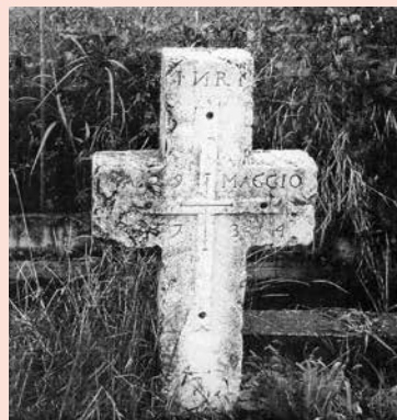
Cippo via San Rocco.

più consistente, lo si versava a fine ottobre, in occasione della “ Festa del ringraziamento ”: in proporzione al raccolto, i nostri contadini versavano al parroco sacchi di grano e quant'altro la terra aveva prodotto.