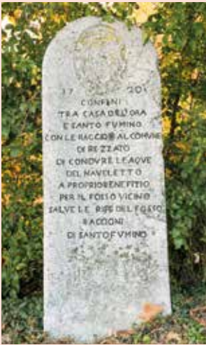
Cippo Cadelora.

È in questo contesto che il Comune utilizza la cartajolly, citando a suo favore, in qualità di testimoni, i due cippi: “...da monumenti visibili eretti a perpetua memoria sul labbro di quella seriola... (la Roberta n.d.a.)” (1)