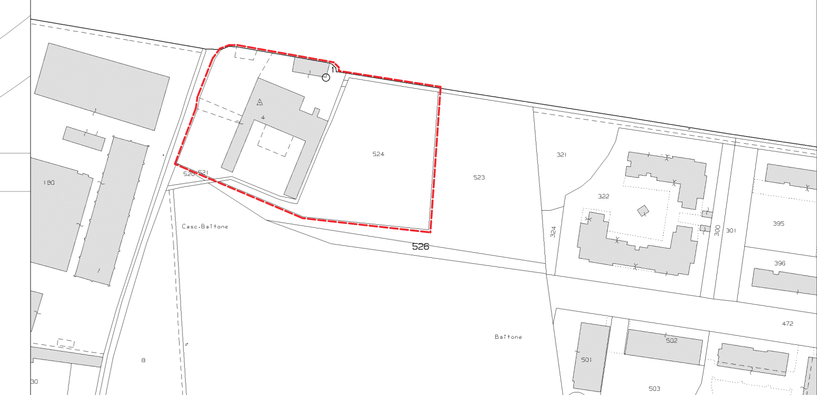
ESTRATTO MAPPA CATASTALE