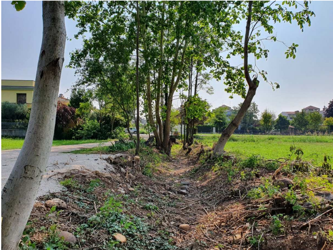
Fotografie del filare di alberi tra la strada bianca e il fosso.